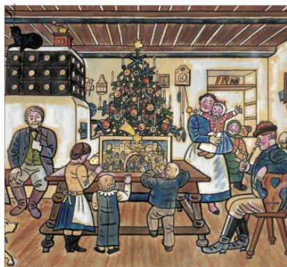
Vánoce podle Josefa Lady (počátek 20. st.)

Zdobení stromečku pro křesťany znamená radost z narození Ježíše Krista a obnovení života, když byl po jeho smrti vzkříšen. Stromeček se nejdříve zdobil ovocem a později bonbony či sladkostmi.